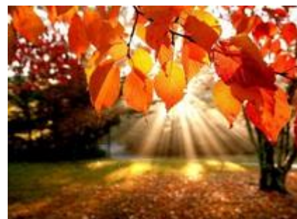
Parko. Aŭtuna suno

Krim spektas, kiel la kato eniras en la parkon post ĉiuj aliaj. Li kontente frotas la manojn, turnas sin kaj malaperas post angulo.