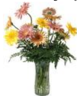
vazo kun floroj

La kuirejo en nia loĝejo ne estas granda. En ĝi estas gasforno, fridujo, manĝotablo kaj kelkaj taburetoj. Sur la muro pendas bildo kun legomoj. Nia loĝejo estas komforta. Mi ŝatas nian loĝejon.