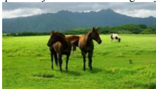
ĉevaloj kaj bovinoj sur herbejo

Jen kion intencis fari la aĉuloj! Mi kuris for, longe-longe tra la arbaro. Mi estis malsata kaj soifa. Sed mi kuris. Finfine mi estis vidinta herbejon, kie estis multaj ĉevaloj kaj bovinoj. Flanke sidis paŝtisto, aŭskultanta radion.